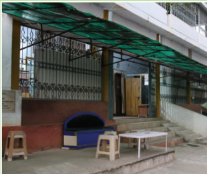
Seit 10 Jahren betreiben die Steyler das St. Arnold-Gesundheitszentrum.