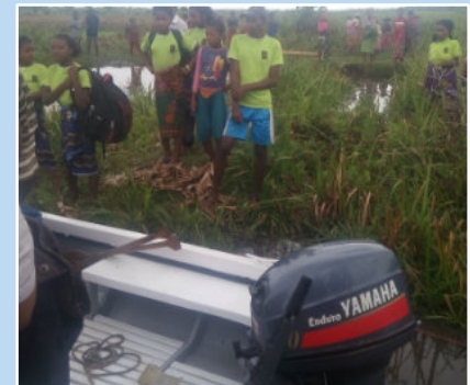
5.000 Euro kostete der neue Außenbordmotor.