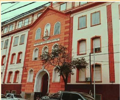
Seit 1937 bilden Steyler im „Instituto Roque Gonzales“ junge Menschen aus.