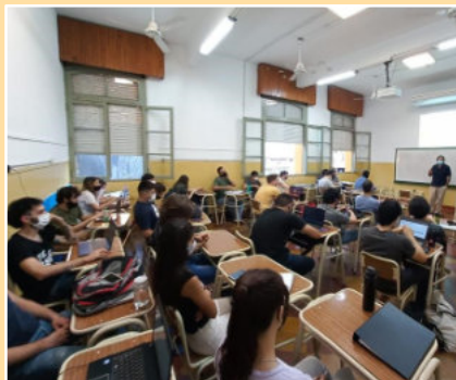
Im dreijährigen Ausbildungskurs werden Jugendliche zu Computer-Spezialisten ausgebildet.