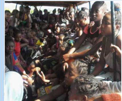
Das Steyler Boot transportiert Hilfsgüter und die Menschen.